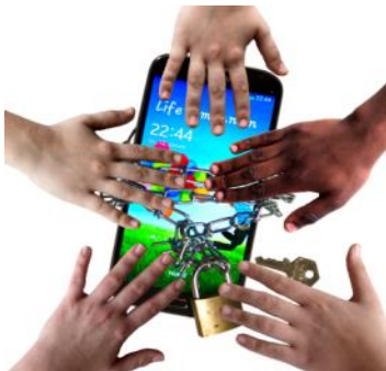
Fotogruppe Medienhak Graz