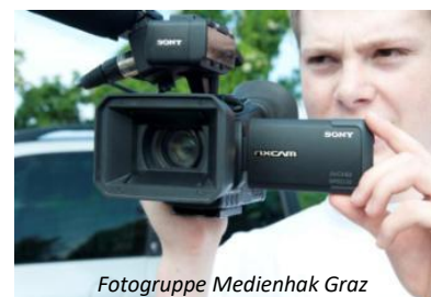
Fotogruppe Medienhak Graz